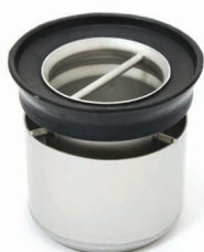
Sifone di scarico antiodore estraibile