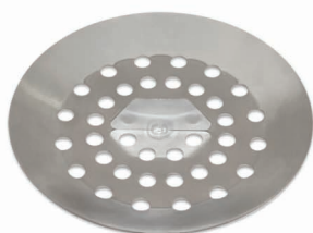
Cestello raccolta impurita estraibile